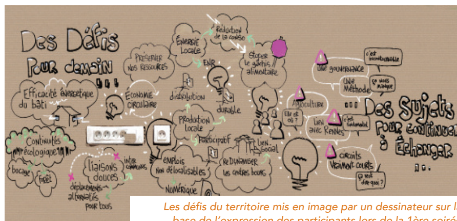
Les défis du territoire mis en image par un dessinateur sur la base de l'expression des participants lors de la 1ère soirée

Dix orientations sont ressorties des groupes de travail donnant lieu à 150 propositions d'actions. 27 ont été retenues comme prioritaires compte tenu de l'importance de leur enjeu pour le territoire et de la capacité de l'EPCI à les mettre en oeuvre. Parmi les chantiers à mener, on trouve la liaison des communes entre-elles par un réseau cyclable, la réalisation d'un schéma de développement des énergies renouvelables, le soutien au développement des circuits courts ou l'exemplarité des marchés publics. Un budget de 441 000 € a été voté, « hors temps agent, investissement pour réaliser les aménagements cyclables, mise en oeuvre du PCAET... » et « en comptant sur de nouveaux soutiens financiers » indique la Vice-Présidente qui compte sur BRUDED « pour alimenter la Communauté de communes en retours d'expériences similaires » afin de l'aider à avancer rapidement. ■