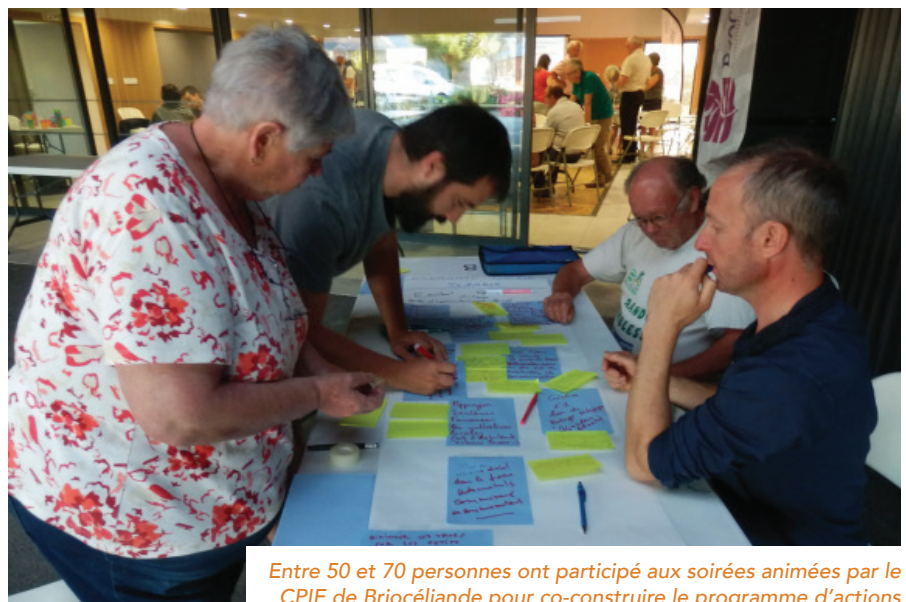
Entre 50 et 70 personnes ont participé aux soirées animées par le CPIE de Brocéliande pour co-construire le programme d'actions