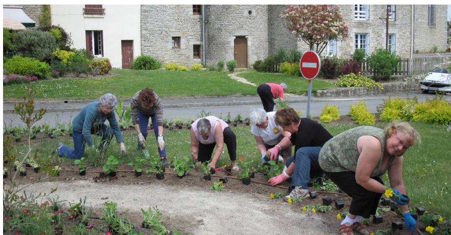
10 000 plants bouturés, 350 jardinières, 80 candélabres... de quoi occuper les services et bénévoles ! La seule mise en oeuvre nécessite 15 jours complets chaque printemps.