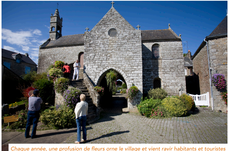
Chaque année, une profusion de fleurs orne le village et vient ravir habitants et touristes

« Ils ont beaucoup évolué depuis les années 80, précise Nicole Royant, adjointe au fleurissement. Au départ, c'était la beauté des fleurs, les couleurs... Maintenant, les jurys demandent davantage de plantes pérennes, des plantations en pleine terre plutôt que dans des jardinières, pas de désherbants chimiques, des cheminements doux... Le tournant a été difficile ! »