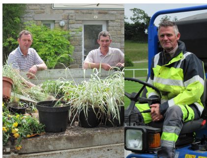
3 temps-plein sont employés aux espaces verts et orchestrent les opérations

Un revirement vers des critères plus environnementaux auxquels les services techniques ont dû s'adapter.