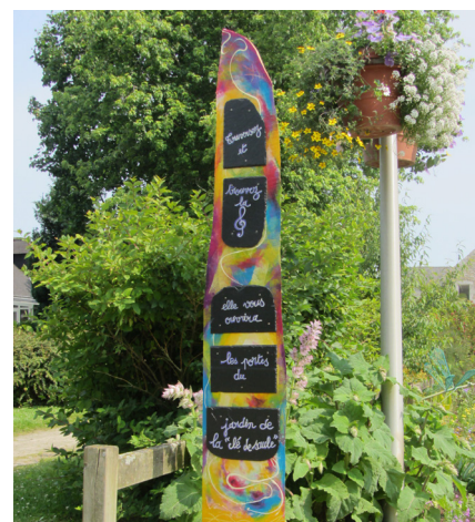
Des totems colorés balisent le Circuit des Jardins

Le défi de demain : continuer d'innover et de réinventer l'embellissement de la commune, en parvenant à renouveler l'équipe bénévole. ■