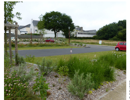
L'aménagement paysager du parking

lumière limite la mise en place de luminaires aux parties de transition avec le centre-bourg, et les sources lumineuses diminuent progressivement vers le sud pour permettre l'obscurité au sein des espaces naturels.