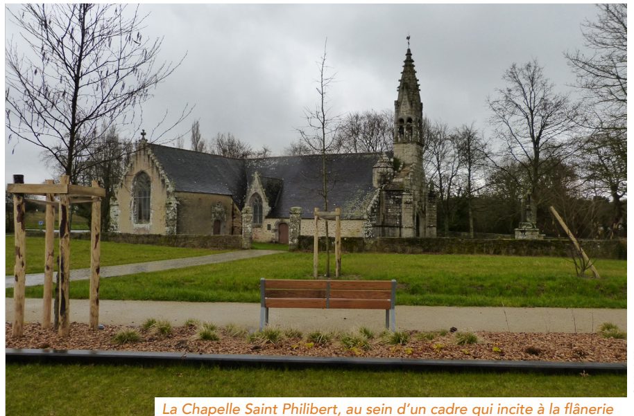
La Chapelle Saint Philibert, au sein d'un cadre qui incite à la flânerie

L'objectif de la démarche a été de définir un véritable projet urbain, intégrant une approche globale et transversale du projet, en assurant de manière harmonieuse le fonc-