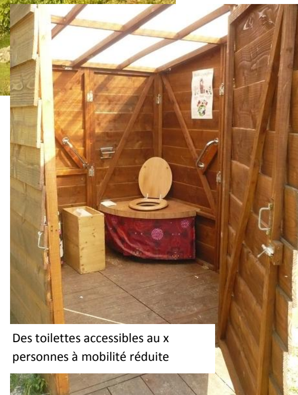
Des toilettes accessibles aux personnes à mobilité réduite