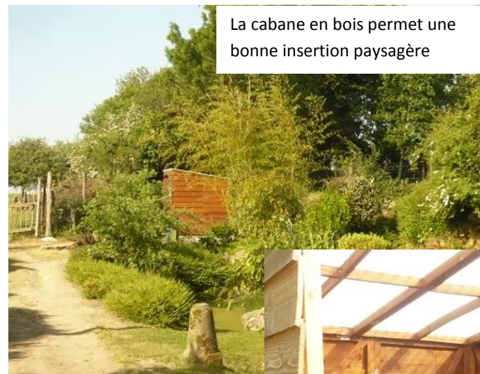
La cabane en bois permet une bonne insertion paysagère

Lucie Lebrun – Bruded - 06 33 04 83 06 – l.lebrun@bruded.org