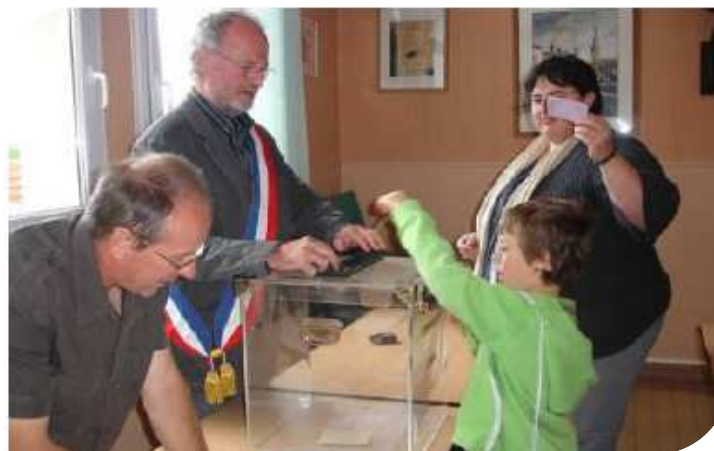
Nom des vaches : Vote des enfants à Guipel