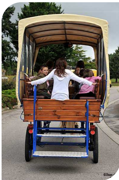
La Chapelle Gaceline