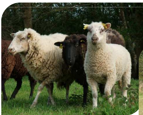
Landes de Bretagne