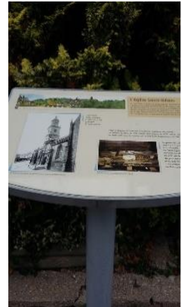
Circuit d'Auray (panneaux situés dans un itinéraire patrimoniale)