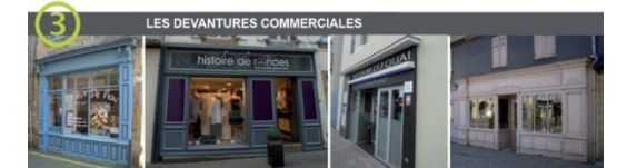
La devanture en applique