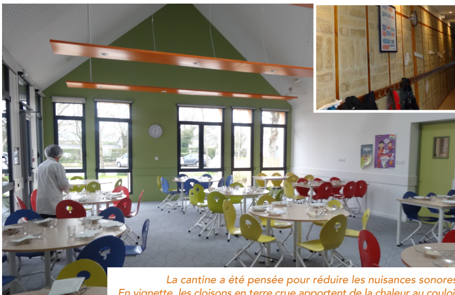
La cantine a été pensée pour réduire les nuisances sonores. En vignette, les cloisons en terre crue apportent de la chaleur au couloir.

Etat (DETR) : 245 000 € Région : 100 000 € Département : 433 454 € Réserves parlementaires : 73 000 € CAF : 37 558 € FCTVA : 271 694 € Autofinancement 2015-17 : 171 044 € Emprunt (20 ans 1,55%) : 450 000 € ■