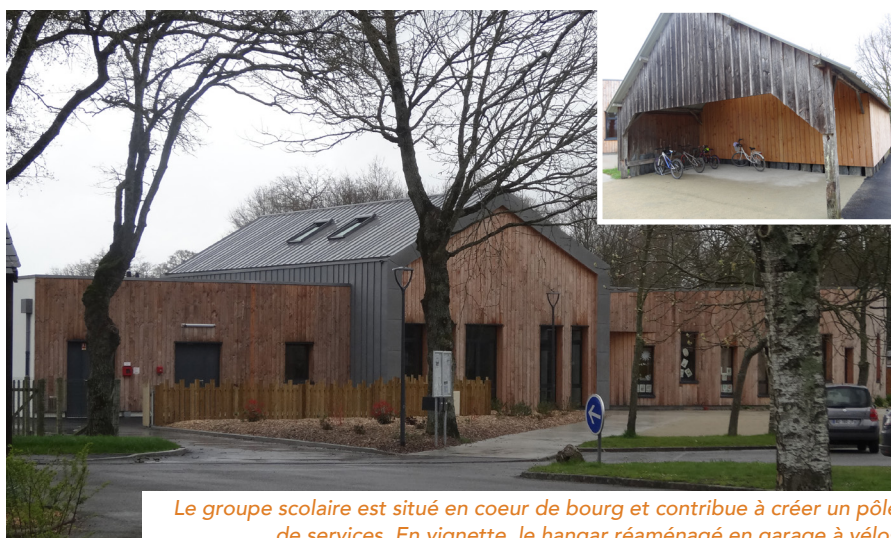
Le groupe scolaire est situé en coeur de bourg et contribue à créer un pôle de services. En vignette, le hangar réaménagé en garage à vélos

« L'un de nos objectifs de départ, partagé avec l'association de parents pour Une Ecole Publique A Treffieux (EPAT), était de proposer un bâtiment cha-