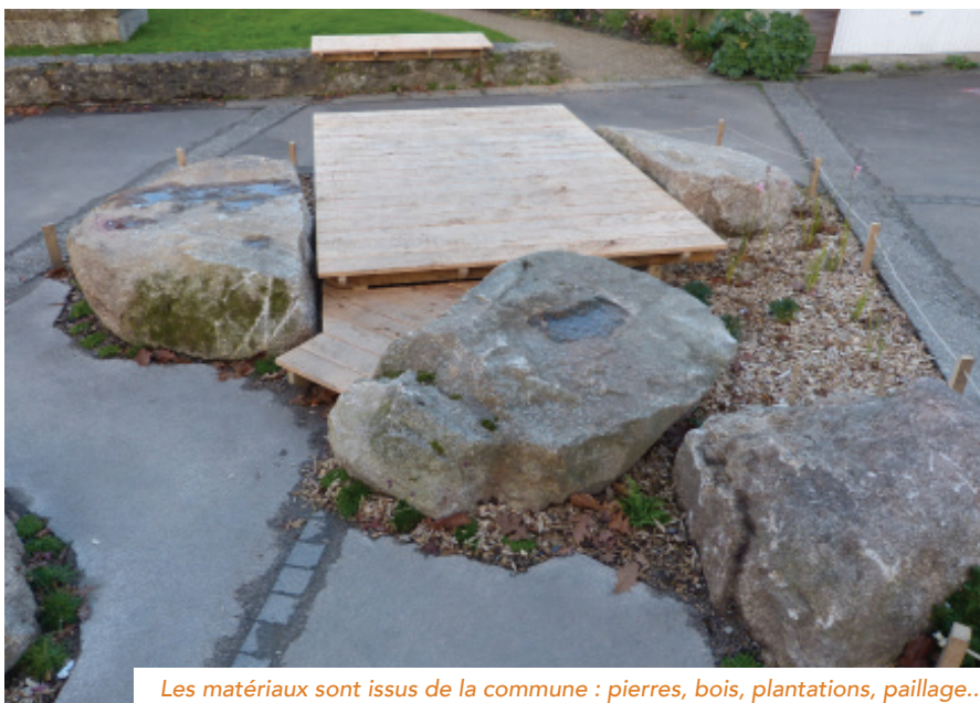
Les matériaux sont issus de la commune : pierres, bois, plantations, paillage...