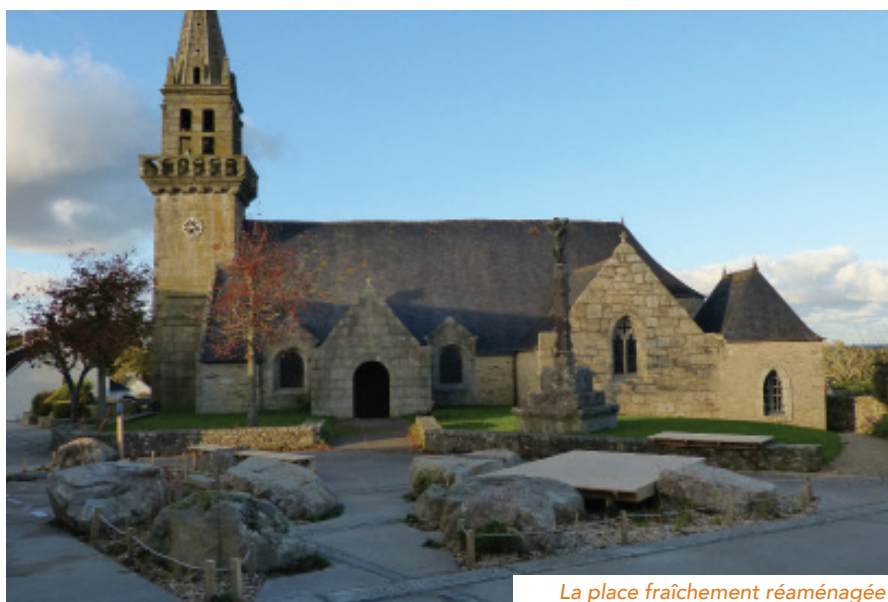
La place fraîchement réaménagée

En 2017, grâce au réseau BRUDED, la municipalité rencontre l'Atelier Bivouac, une équipe d'architectes paysagistes qui abordent les questions d'aménagement d'espaces publics de manière originale. Leur pratique du projet se fonde sur une démarche d'immersion afin d'aller à la rencontre des habitants. Ils se positionnent dans une économie de moyens pour tirer le meilleur parti des ressources locales ou issues du réemploi et du recyclage.