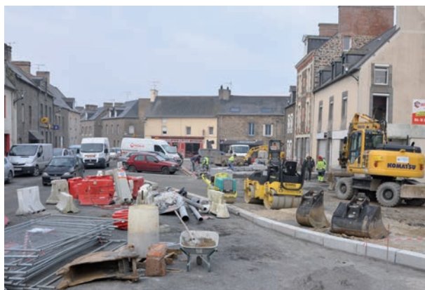
Le grand chantier