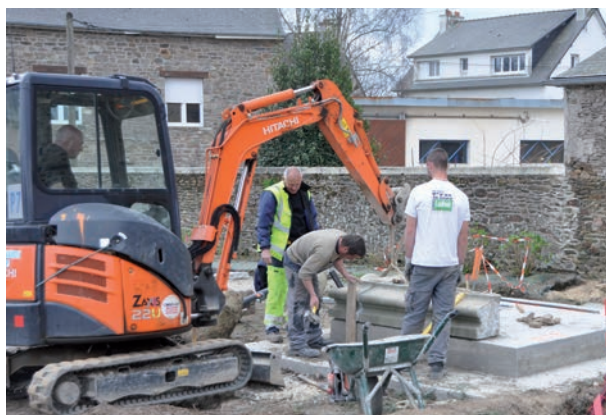
Reconstruction du monument aux morts

L'ingéniosité des hommes, le ballet des engins et la force des matériels au service d'un chantier qui va durer vingt mois.