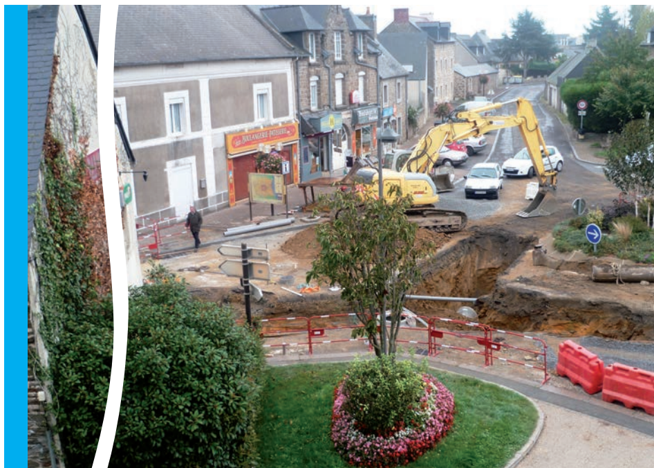
Effacement des réseaux