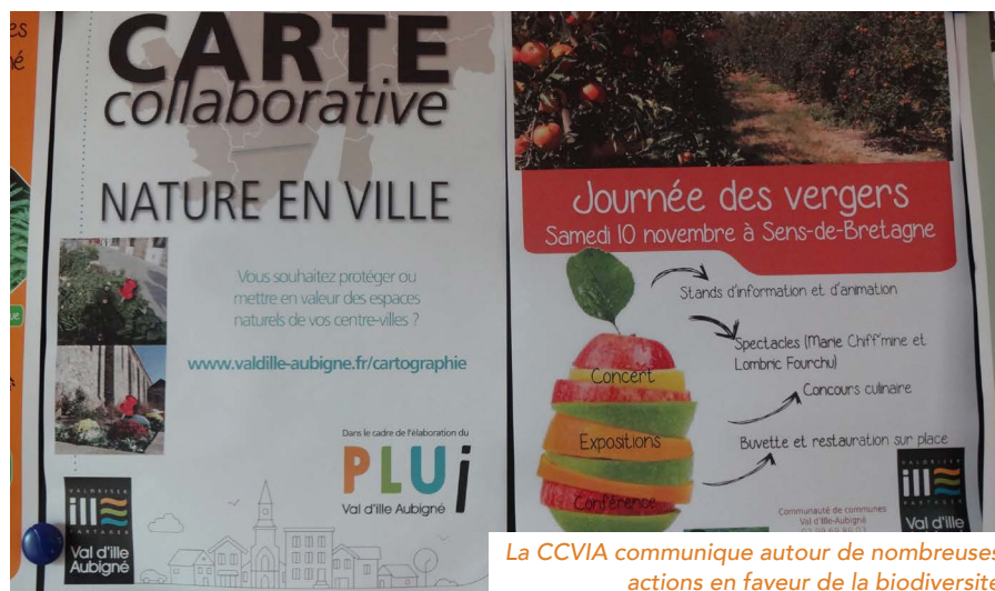
La CCVIA communique autour de nombreuses actions en faveur de la biodiversité

Le schéma de la trame verte et bleue doit être intégré dans les autres documents de planification : PLUi (via une OAP), PLH, PCAET... « La difficulté est de faire le lien entre ces différentes politiques, et a fortiori pour l'élu communal qui ne participe pas à tous les plans d'actions » indique l'élu. L'ensemble de ces documents, travaillés en même temps, devraient être validés en 2019 pour être opérationnels lors la prochaine mandature. ■