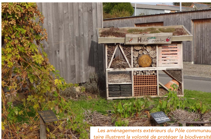
Les aménagements extérieurs du Pôle communautaire illustrent la volonté de protéger la biodiversité.

En 2017, la « nouvelle » CCVIA lance l'élaboration d'un nouveau schéma. « Il a fallu impliquer les communes de l'ex-CCPA ; cela a été facilité