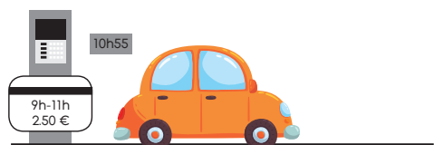
Je paie la somme exigée et je libère ma place à 10h55 Je suis en règle