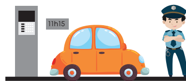
Je dépasse la durée autorisée

Un agent passe et constate l'insuffisance de paiement. Il établit un FPS. La somme déjà payée à l'horodateur est déduite.