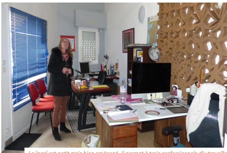
Le local est petit mais bien aménagé, il permet à trois professionnels d'y travailler