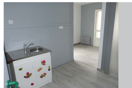
Le local en face est libre et aménagé

Il n'a pas été utile de rédiger un règlement intérieur car les trois