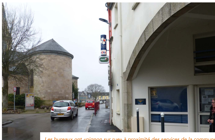
Les bureaux ont « pignon sur rue » à proximité des services de la commune

Aujourd'hui, les trois personnes sont un peu l'étroit : il est impossible d'accueillir un(e) stagiaire ou même une personne en rendez-vous privé et il n'y a pas de réel espace de stockage (les toilettes assez grands font office de lieu de rangement...). Début 2019, la commune a ainsi proposé un nouveau local (anciennement occupé par le dentiste puis un kiné qui a quitté la commune) qu'elle avait remis en état pour permettre à l'une des professionnelles de s'y installer avec une stagiaire : situé en face du bureau actuel, la proximité est de mise. Il comprend trois pièces et une cuisine et pourrait ainsi accueillir encore une autre personne. ■