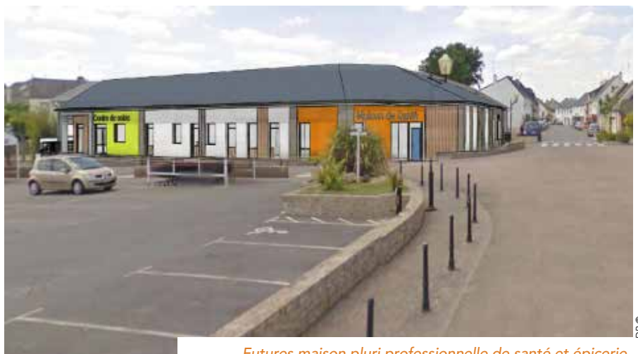
Futures maison pluri professionnelle de santé et épicerie

L'équipe municipale ne tarde pas à réagir. L'enjeu pour la commune est de réaffirmer sa centralité en termes de services et de commerces. Elle missionne le cabinet Cibles et Stratégies pour réaliser un diagnostic global au niveau commerce, santé, habitation. Elle