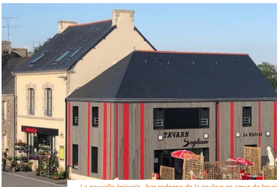
La nouvelle épicerie - bar redonne de la couleur en cœur de bourg

Devant la fermeture brutale de la dernière épicerie fin 2015, la commune avait lancé, tambour battant, le projet de rénover une ancienne crêperie en épicerie-bar, en passant par la création d'une épicerie communale temporaire (voir fiche BRUDED). D'une démarche qui semblait simple au départ, la commune a rencontré différents aléas et embûches qui allaient ralentir le projet, mais certainement pas y mettre fin.