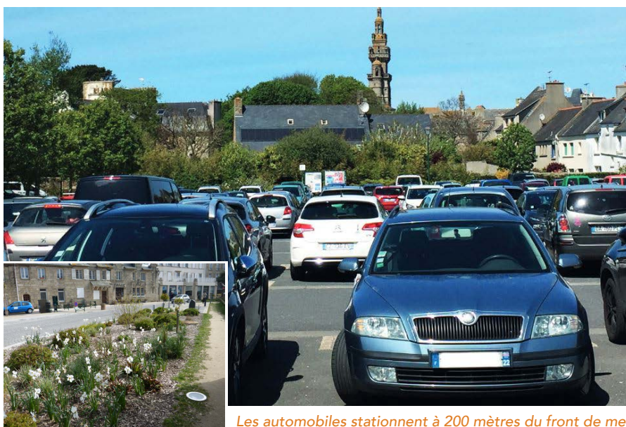
Les automobiles stationnent à 200 mètres du front de mer et à l'écart des rues piétonnes

Dans le cadre de son projet de territoire 2011-21 et des engagements pris dans l'Agenda 21 approuvé en 2009, la municipalité met en place un nouveau plan de circulation et de stationnement dès 2013. Il permet d'apaiser et de fluidifier la circulation pour rendre la ville plus agréable. Pour les Roscovites, cela s'est traduit par moins de nuisances et de trafic de transit (et donc moins d'espaces de stationnement dans