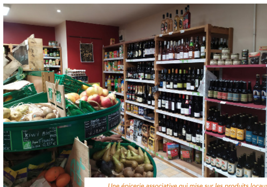
Une épicerie associative qui mise sur les produits locaux

Des travaux d'agrandissement sont envisagés pour développer la préparation de plats cuisinés. Les membres de l'association préparent le projet, qui sera ensuite étudié par les élus qui apporteront un soutien technique et contribueront à la recherche de financement. « Pour la municipalité, c'est une occasion de rénover des locaux vacants et dégradés en centre bourg, qui contribueront ainsi à un service au public ». ■