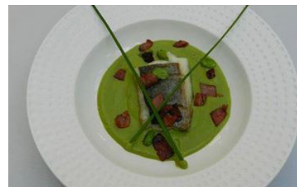
Des plats préparés sont désormais disponibles

événements culturels, festifs, des partages de savoirs, et s'associe à d'autres associations du territoire, l'école, l'Ehpad, la bibliothèque (...) pour porter des projets citoyens.