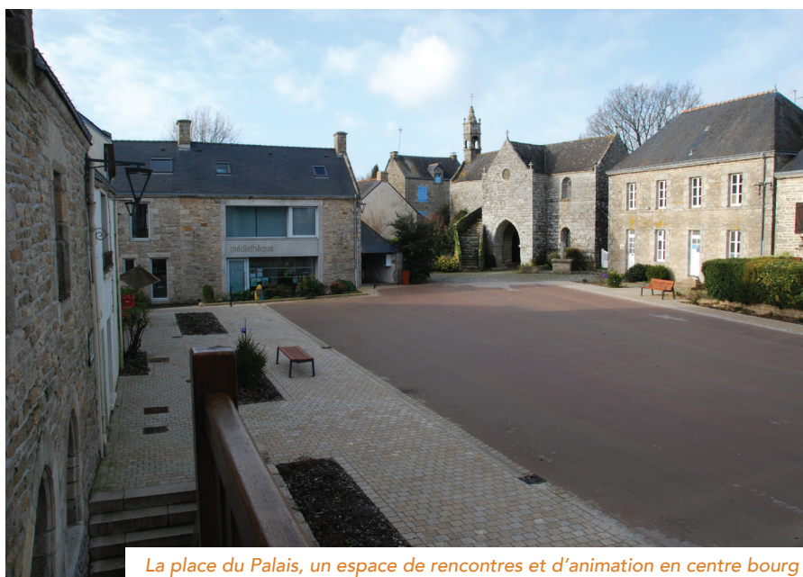
La place du Palais, un espace de rencontres et d'animation en centre bourg

Ils recensent alors les différents équipements de la commune, ainsi que les bâtiments et terrains stratégiques et disponibles en centre bourg. En parallèle, ils font l'état des lieux des besoins et usages possibles. « Face à l'ampleur de la tâche, nous avons rapidement fait appel au CAUE et au cabinet TerrAterre pour nous assister dans la démarche », se souvient le maire. Des ateliers participatifs enrichissent le diagnostic avec les avis, pratiques et besoins des habitants. Les élus visitent aussi d'autres communes (Monteneuf, Locmaria-Grand-Champ, La chapelle Caro) dont certaines avec BRUDED, pour nourrir leur réflexion et s'inspirer d'autres expériences. Après deux ans de travail, le Plan de référence final est adopté par le conseil municipal début