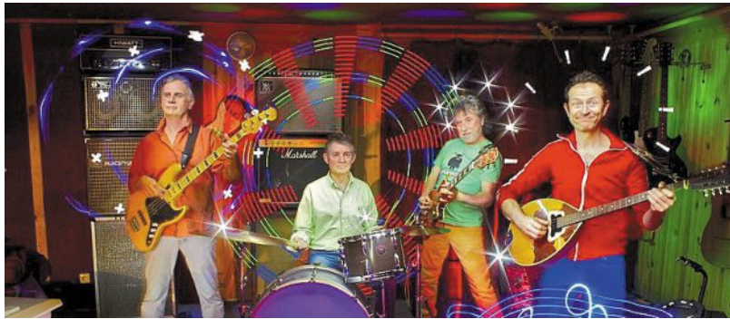
Ce groupe nantais de rock pour enfants a été créé en 1981.

Les Bouskidou sont À fond avec leur concert. Certes, le groupe n'a pas inventé le rock'n'roll ni la chanson pour enfants... Mais il ose mélanger les deux. Cette compil' de chansons extraites de leurs différents albums le prouve.