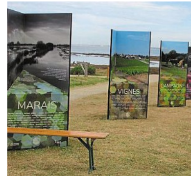
Pour mieux connaître et comprendre les paysages, le CAUE propose un parcours imagé.

Pour chacune des six grandes familles de paysages du département, une double lecture permet de s'immerger dans les spécificités du territoire : une approche sensible et culturelle à travers différents regards photographiques, et une approche objective à travers des paroles d'acteurs du territoire et des éclaira-