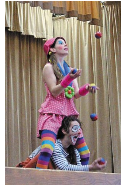
Un spectacle pour les enfants.

Mardi 4 août , à 21 h, square Thibaud (face à l'église). Entrée libre (en cas de mauvais temps spectacle donné à la salle des fêtes Olivier Hureau).