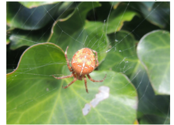
Epeire diadème au centre de sa toile tendue entre des feuilles de lierre - Porspoder - octobre 2021