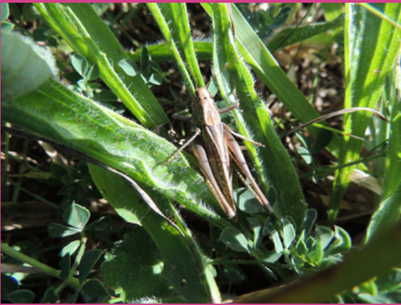
Decticelle grisâtre mâle sur du plantain lancéolé - septembre 2021 - Porspoder

La Decticelle grisâtre ( Platycleis albopunctata ) est l'une des 4 espèces de sauterelles inventoriées sur Porspoder. Avec ses longues antennes et ses ailes (élytres) ponctuées de petits points blancs, elle aime prendre le soleil le long des murs des jardins. La femelle se reconnaît à son « oviscapte » long et courbé, sorte de petit crochet au bout de son corps qui lui permet d'enfouir ses œufs. Pour l'accueillir dans votre jardin, conservez des espaces non tondus et écoutez-la chanter tout l'été ! https://sonotheque.mnhn.fr/