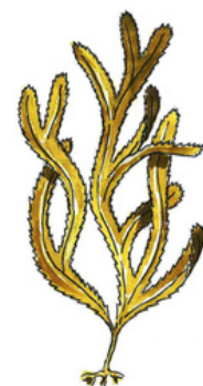
Fucus serratus - aquarelle @Arbo