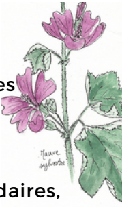
Mauve sylvestre - aquarelle @Hermione Guinot

Ce printemps, la commune commencera une nouvelle réflexion sur son fleurissement ! Les objectifs sont d'économiser l'eau d'arrosage et de donner la place à des espèces locales mieux adaptées au climat et plus accueillantes pour la biodiversité. Pour arroser les jardinières qui sont accrochées tous les étés aux lampadaires, il faut 6 heures de travail pour pomper environ 900 litres d'eau chaque semaine et cela pendant 8 semaines en été ! L'eau est prélevée dans un lavoir, ce qui n'est pas sans conséquence non plus sur le petit peuple de tritons et autres batraciens... Nous proposons donc cette saison, de réduire le nombre de jardinières et de les concentrer en centre-bourg !