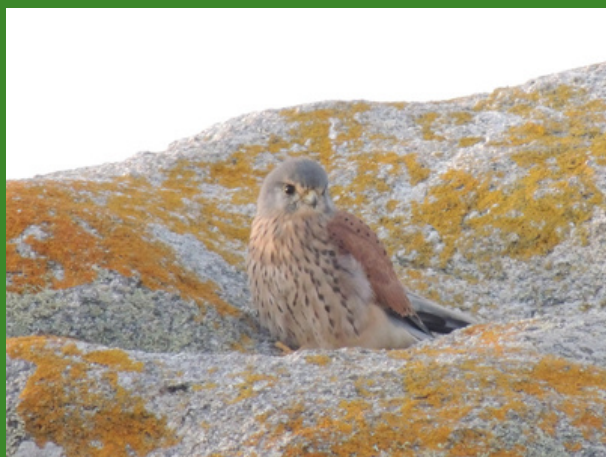
Jeune Faucon crécerelle - Presqu'île Saint-Laurent - Porspoder

Le faucon crécerelle ( Falco tinnunculus ) est un petit rapace à longue queue. Il se nourrit d'insectes, de petits rongeurs, d'amphibiens ou de reptiles. Pour les chasser, il les guette sur un point haut (poteau, arbre...) ou alors vole en stationnaire, en battant très vite des ailes et en baissant la tête, dans une attitude très caractéristique appelée « Saint-Esprit ». Lorsqu'il repère une proie, il plonge sur elle en piqué et l'attrape avec ses serres. Il niche sur les rochers de la Presqu'île Saint-Laurent à partir d'avril : alors, pour ne pas le déranger, éviter l'escalade !