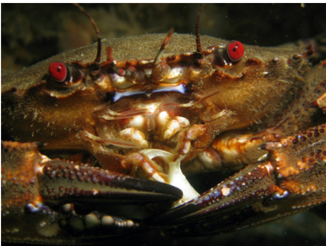
Etrille commune ( Necora puber ) - Iroise - 2009

L'étrille ( Necora puber ) est un crabe bien connu des pêcheurs à pied. Elle se reconnaît à ses pattes arrière aplaties et à ses yeux rouges. Elle se cache sous les rochers de Melon ou de Mazou et découpe sa nourriture avec ses pinces aux dents pointues. Sa taille de capture minimale est fixée à 6,5 cm.