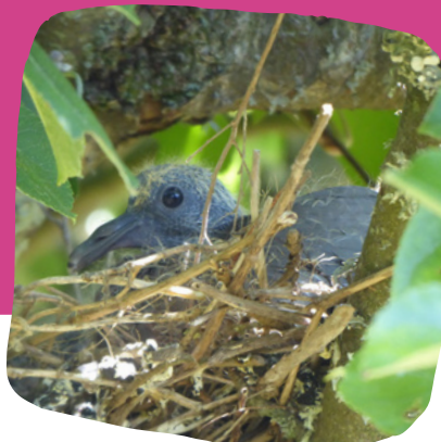
Poussin de Pigeon ramier ( Columba palumbus ) - mai 2020 - Kermerrien - Porspoder