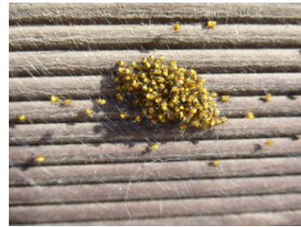
Eclosion de petites Epeires diadème dans un jardin de Porspoder - mai 2021