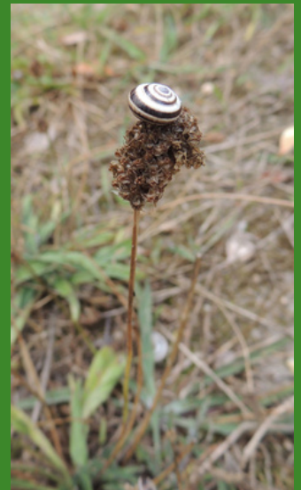
Escargot des dunes sur une tige de plantain - dunes de Porspoder - septembre 2021

L'escargot des dunes ( Theba pisana ) est un habitué du littoral de Porspoder. Il se déplace la nuit pour manger des plantes comme le fenouil. Le sable qu'il absorbe à cette même occasion lui sert à fabriquer sa coquille. Quand il fait un peu chaud, il grimpe en haut des tiges ou sur les poteaux de bois et scelle l'ouverture de sa coquille. Il côtoie souvent un autre tout petit escargot, appelé Cornet étroit ou escargot pointu ( Cochlicella acuta ).