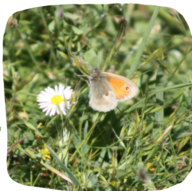
Fadet commun - Dunes de Porspoder - mai 2020

Le fadet commun ( Coenonympha pamphilus ) est un minuscule papillon de jour. Ses ailes antérieures orange portent un petit « œil », ou ocelle noir avec une pupille blanche. Il est parmi les premiers papillons à arriver sur les dunes de Porspoder au début du printemps.