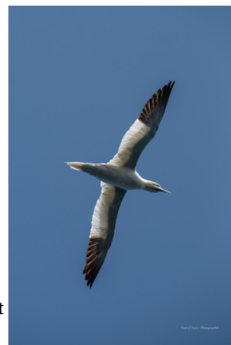
Fou de Bassan - Porspoder

Le plus grand oiseau marin de l'hémisphère nord est observable depuis les pointes de Garchine ou de la Presqu'île Saint-Laurent. Plutôt habitué de la haute mer, le Fou de Bassan ( Morus bassanus ) se rapproche des côtes pour suivre le poisson. La mer d'Iroise est une zone de pêche très importante pour cet oiseau qui niche uniquement en France dans l'archipel des Sept-Iles.