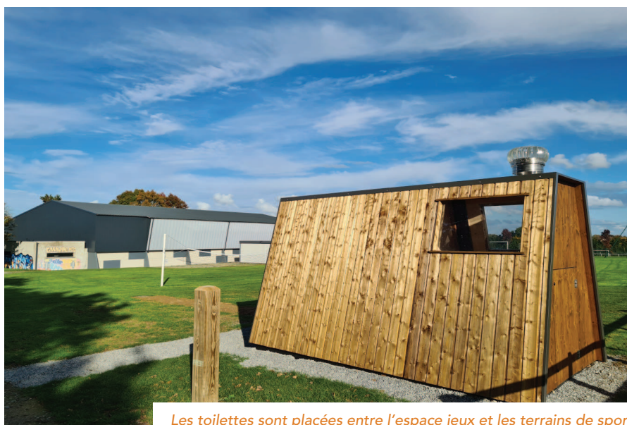
Les toilettes sont placées entre l'espace jeux et les terrains de sport

La salle des sports, rénovée et agrandie, est livrée fin 2021. « A l'issue de ce premier projet nous avons lancé une réflexion pour compléter l'offre