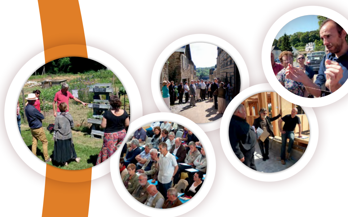
www.lcdesign.fr - Photos et réalisation : BRUDED, Octobre 2022

Breizh ar maezioù ha maezkerel evit an diorren padus