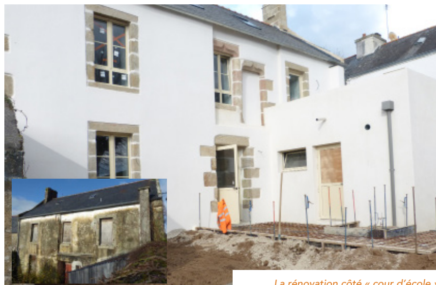
La rénovation côté « cour d'école »