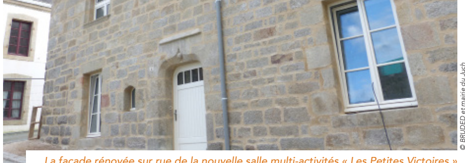
La façade rénovée sur rue de la nouvelle salle multi-activités « Les Petites Victoires »

La commune est propriétaire depuis 2016 de l'ancienne Maison des Sœurs (inhabitée depuis 2007). Cette bâtisse de caractère qui est sans doute la plus ancienne du village, fut cédée à des religieuses en 1877 moyennant l'obligation d'assurer des soins et l'enseignement primaire.