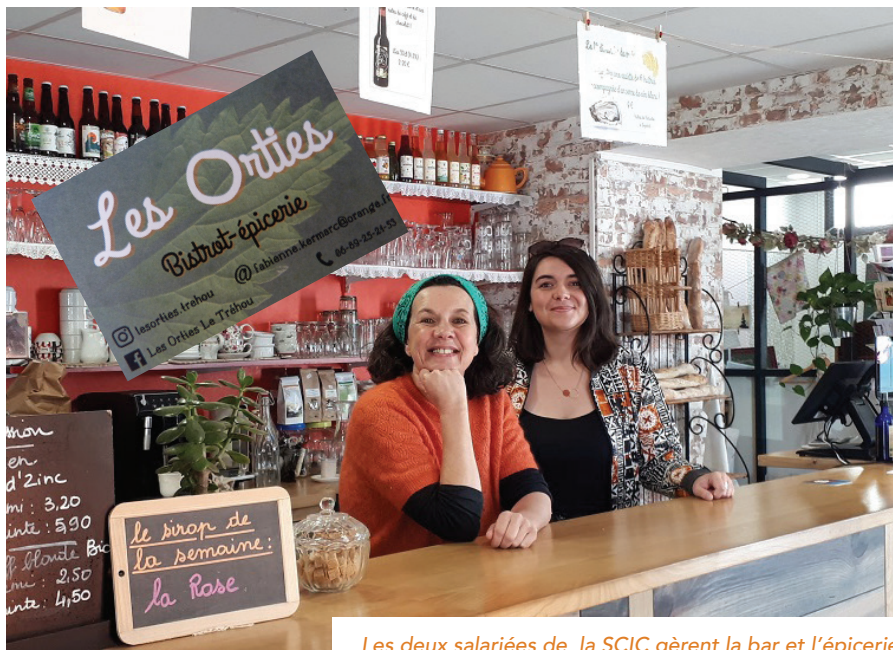
Les deux salariées de la SCIC gèrent la bar et l'épicerie

Les loyers perçus couvrent le montant du prêt de la commune rendant cette opération « blanche ». ■