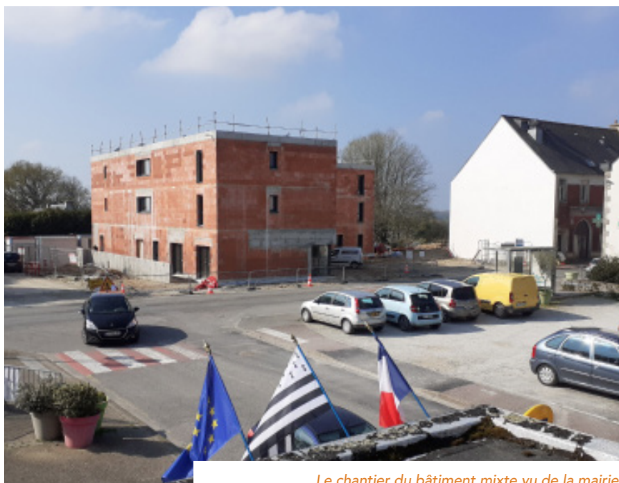
Le chantier du bâtiment mixte vu de la mairie.

Les travaux d'aménagement des espaces publics, estimés à 800 000€, sont en cours d'études, tout comme les recherches de financements. À ce stade, l'ensemble des opérations est financé à 56% pour un reste à charge provisoire pour la commune de 1 275 K€. Les partenaires financiers du projet sont l'État, la Région, le Département du Finistère, Quimperlé Co et l'EPF. ■