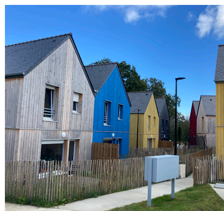
Plomelin (architecte Atelier TLPA)

Grâce à un volume fin et en longueur qui permet de toujours laisser le jardin libre à l'ouest ou au sud, des vues et expositions variées grâce aux parcelles différentes et un fonctionnement intérieur facilitant l'implantation d'extensions.