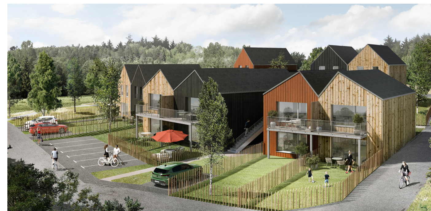
Landudec (architecte Atelier TLPA)