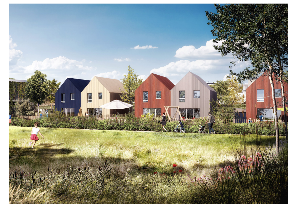
Guilers (architecte Atelier TLPA)