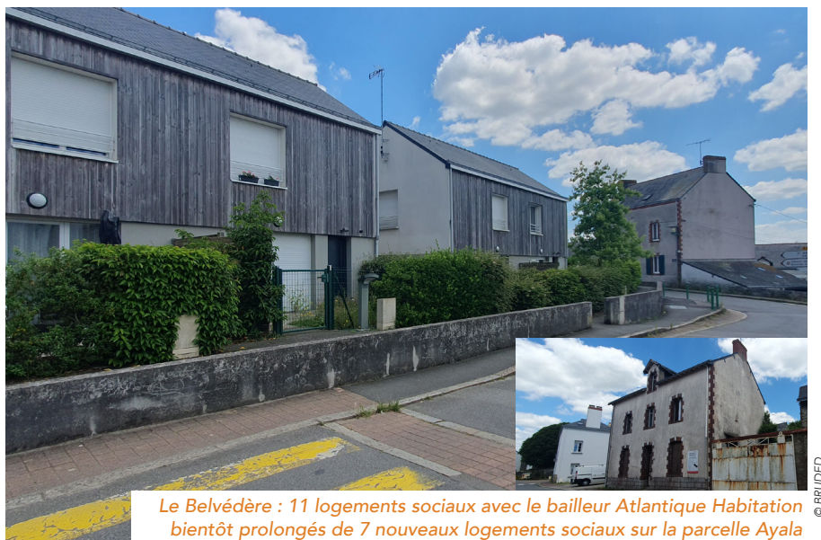
Le Belvédère : 11 logements sociaux avec le bailleur Atlantique Habitation bientôt prolongés de 7 nouveaux logements sociaux sur la parcelle Ayala

Aujourd'hui ce sont les réhabilitations de deux bâtiments patrimoniaux qui occupent l'actualité communale : la réhabilitation du presbytère en tiers-lieu, salle de réception et logements touristiques et le renouvellement urbain de la parcelle dite "Ayala" en sept logements sociaux, dont deux dans la maison réhabilitée. Deux autres bâtiments reprenant le gabarit de la maison seront construits en fond de parcelle. La reprise de l'existant et le maintien des formes urbaines