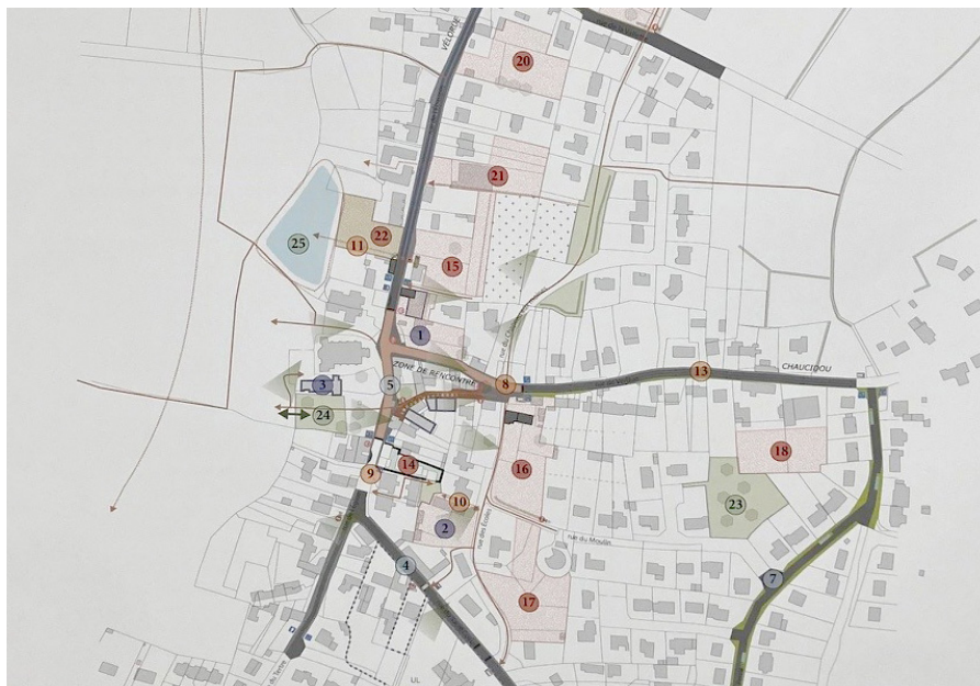
Le plan guide a permis de définir le potentiel de densification de certaines parcelles privées en centre-bourg en réalisant des schémas programmatiques quantitatifs et qualitatifs. Un travail utile pour ouvrir la discussion avec les porteurs des projets privés.

"Cultiver le dialogue avec les habitants pour pouvoir agir en amont des projets et les réorienter au besoin. L'idée étant de faire se rencontrer les intérêts privés et les intérêts de la collectivité autant que possible. C'est aussi cela que nous défendons lorsque nous soutenons un projet privé ou proposons un budget participatif. Il doit servir à porter une idée d'intérêt collectif, de la commune." partagent les élus. ■