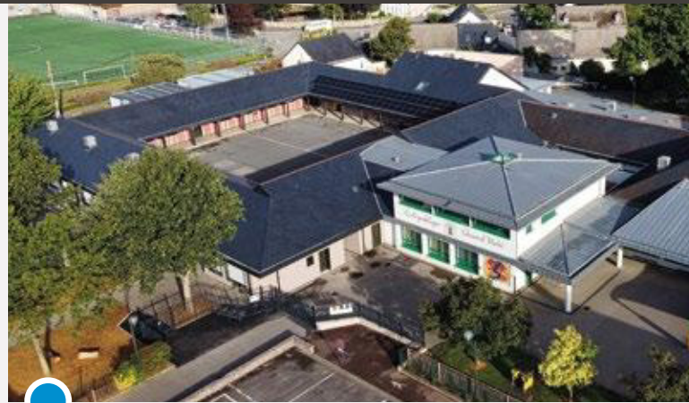
École primaire publique Édouard MAHÉ.

En été, il permet également un rafraîchissement nocturne , tout en limitant les consommations électriques. La restauration scolaire est dotée d'une ventilation double flux.