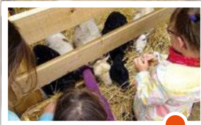
Visite à la ferme