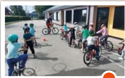
Dispositif « Savoir rouler »