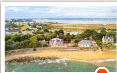
Séjour Batz sur Mer

20 rue Tanvet 35240 Retiers Tél. : 02 99 43 53 80 ecole.0350426y@ac-rennes.fr